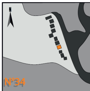
quartier du Saous